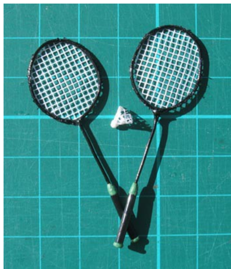
Raquettes et volant de badminton au 1/12